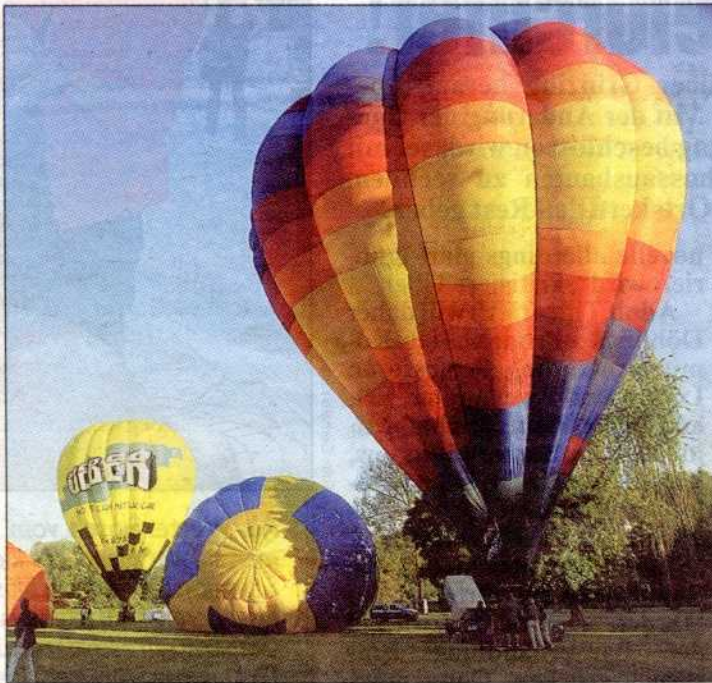
Kommenden Samstag erheben sich 25 Ballone in die Lüfte