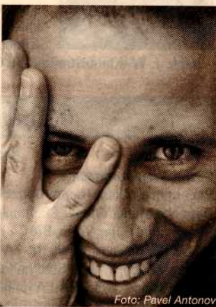
Information und Karten: T: 01/242 002 www.konzerthaus.at