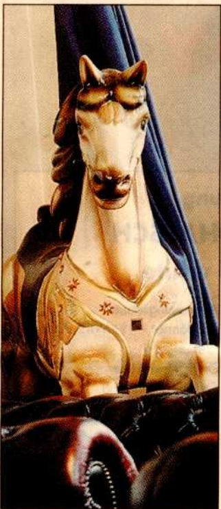
Ein ungewöhnlicher Blickfang: ein Karussellpferd im Stadtratbüro.

Warum? „Postendebatten sind die Lieblingsdiskussion der Öffentlichkeit“, sagt Laska im STANDARD-Gespräch betont gelassen. Der zweite Aspekt sei sicherlich der, dass „ich heuer 55 Jahre alt werde und man nicht mehr davon ausgeht, dass sich meine Lebens-