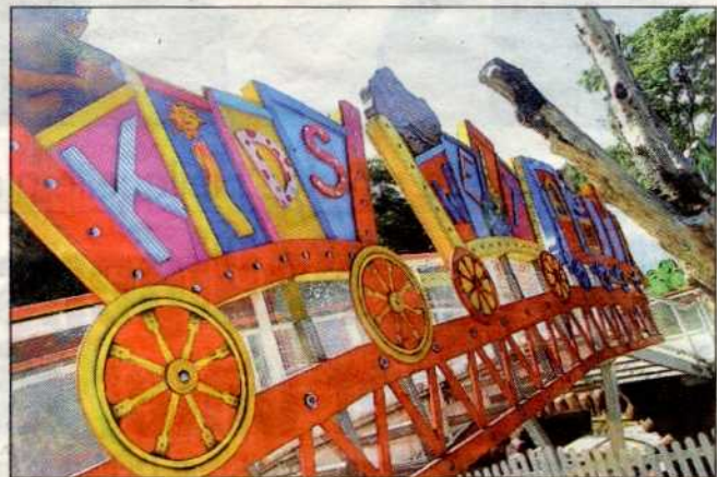
Die Kids-Welt im Prater ist ein Paradies für Sprösslinge, die noch nicht mit schnellen Gefährten unterwegs sind.

Zu den Angeboten gibt es auch Ermäßigungen.