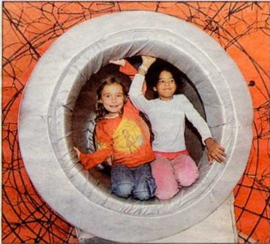
Das ZOOM-Kindermuseum bietet Ausstellungen und Workshops zum Mitmachen an. Schüler schätzen das abwechslungsreiche Programm.