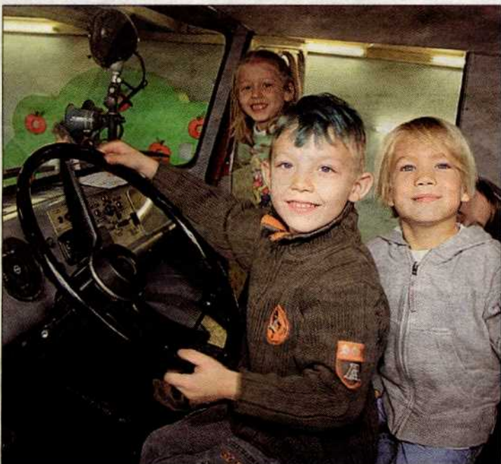
◀ Im Technischen Museum wurde das Mini, ein eigener Bereich für Besucher im Kindergartenalter, eingerichtet.