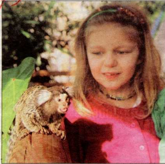
Die süßen kleinen Äffchen zählen zu den Kinderliebungen im Haus des Meeres in Mariahilf.