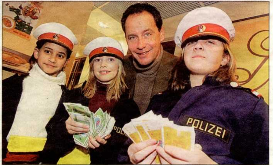
▲ In Minopolis, der Stadt der Kinder, lernen die Sprösslinge, wie sie mit einem Job Geld verdienen können.