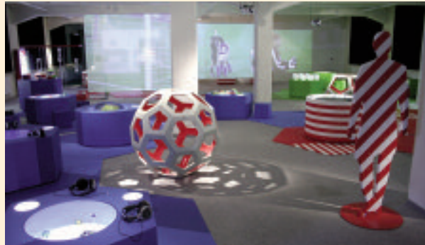
Die Ausstellung „Rund um den Ball“ im ZOOM Kindermuseum