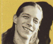
Zwrschina, ein Sandler Alegz Obernigg